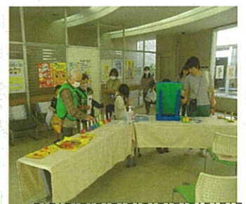
レクリエーション グッズ展示