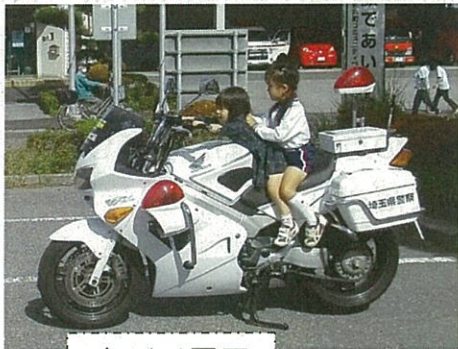
白バイ展示 煙体験