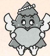
杉戸町マスコットキャラクター 「すぎぴょん」