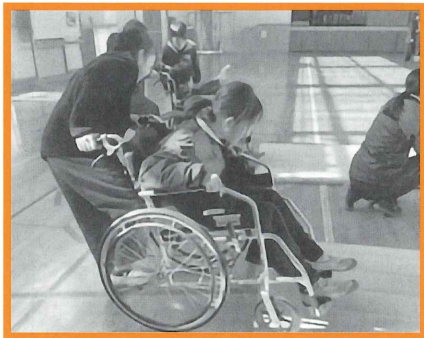
車いす体験時、段差での車いす持ち上げの補助や見守りをさせていただきます